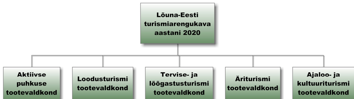
Joonis 1. Lõuna-Eesti turismi arengukava tooteskeem

Arengukava koostamise tuumaks on jätkata regiooni arendamist ja turundamist tootepõhiselt. Selleks töötatakse välja viis regiooniomast turismitoodet. Tootepõhise lähenemise kasuks otsustati seetõttu, et järjest rohkem teevad turistid külastusotsuseid huvipakkuvate toodete baasil. Senine haldusjaotusekeskne lähenemine ei too välja kõiki regiooni tugevusi. Tootepõhine turundamine võimaldab tuua regiooni rohkem turiste ning seeläbi suurendada regiooni turismituluseid.