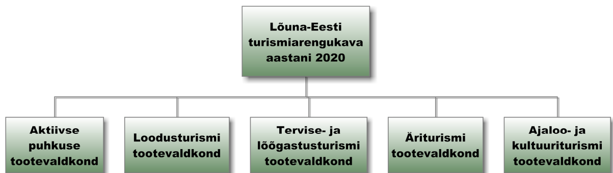
Joonis 1. Lõuna-Eesti turismi arengukava tooteskeem

Arengukava koostamise tuumaks on jätkata regiooni arendamist ja turundamist tootepõhiselt. Selleks töötatakse välja viis regioonimast turismitoodet. Tootepõhise lähenemise kasuks otsustati seetõttu, et järjest rohkem teevad turistid külastusotsuseid huvipakkuvate toodete baasil. Senine haldusjaotusekeskne lähenemine ei too välja kõiki regiooni tugevusi. Tootepõhine turundamine võimaldab tuua regiooni rohkem turiste ning seeläbi suurendada regiooni turismitulusid.