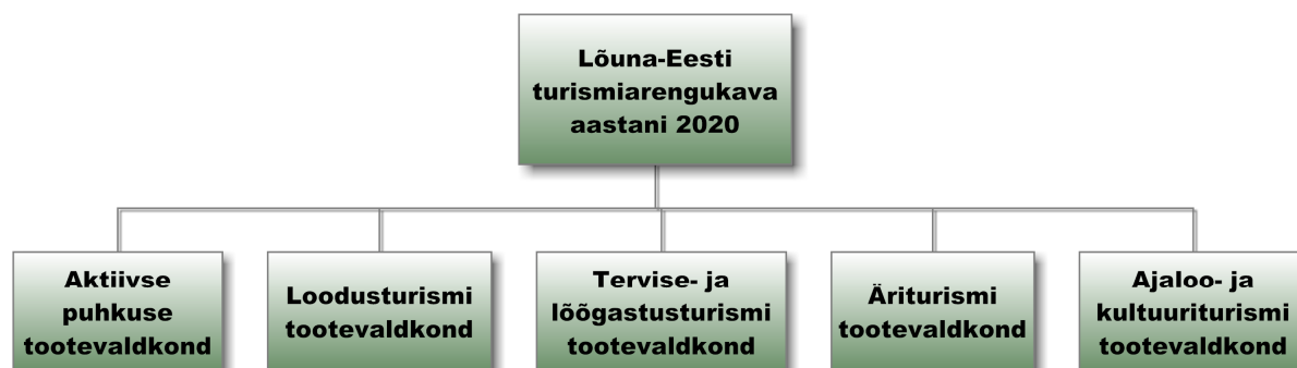
Joonis 1. Lõuna-Eesti turismi arengukava tooteskeem

SA Lõuna-Eesti Turism tellimisel ja regiooni turismiasjaliste ühistööna valminud Lõuna-Eesti turismi arengukava määratleb järgnevas kümneks aastaks Lõuna-Eesti turismiregiooni põhilised arengusuunad ja tegevusvaldkonnad. Arengukava tuumaks on jätkata regiooni arendamist ja turundamist tootepõhiselt. Selleks töötatakse välja viis regiooniomast turismitoodet.