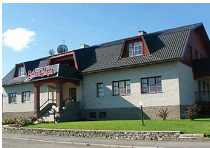
Joonis 7: Heleni Maja

Heleni Maja (vt joonis 7) on suurim majutust pakkuv ettevõtte Põltsamaal, mis alustas oma tegevust 1995.a. Külalistemaja suudab majutada kuni 32 inimest. Majas on ka saun ning ajaviiteks saab mängida piljardit. Maja ees on suur parkla, mis sobib ka busside parkimiseks. Igas toas on televiisor, telefon ja WiFi ühendus.