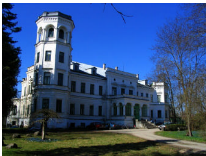
Joonis 5: Puurmani mõis

Ka Puurmani ja Pajusi vallas on olemas kaunid mõisahooned. Puurmani mõis (vt joonis 5) rajati 14. saj keskel. Suurejoonelise neo-renessanss stiilis peahoonega mõisaansambel ehitati krahv G. J.v. Mannteuffeli ajal 1860. a. Lossil on 25 m kõrgune kaheksakandiline nurgatorn. Puurmani lossis moodustas Juljus Kuperjanov 1918. a partisanide pataljoni. Lossi ümbritseb huvitava kujundusega park , mis on riikliku kaitse all. Praegu asuvad siin keskkool ja raamatukogu.