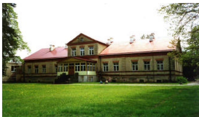
Joonis 4: Adavere mõis