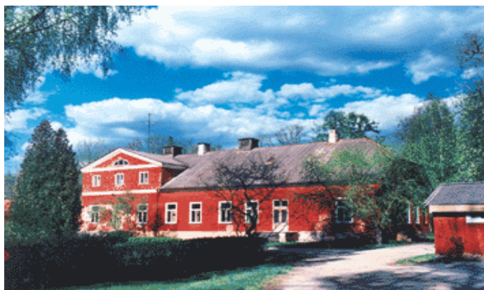
Joonis 6: Pajusi mõis

Pajusi mõisa häärber on mansardkorrusega kivihoone, mida lühendati ühe tiiva võrra 1930.-ndate lõpul. Praegu asub Pajusi mõisahoones rahvamaja.