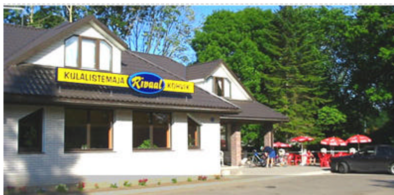
Joonis 8: Rivaal

Rivaali külalistemaja (vt joonis 8) asub Põltsamaa kesklinnas Põltsamaa jõe ning roosisaare vahetus läheduses. Külalistemajas on 9 tuba, kokku 20 voodikohta. Kõikides tubades on dušš, televiisor (SAT-TV) ja interneti püsiühendus. Majas on saun, mida saavad kõik soovijad ka eraldi tellida. Rivaali külalistemajas on võimalik toitlustada suuremaid grupe. Olemas on eraldi privaatruum 40 ning kaminaga kohvikusaal 50 kohaga.