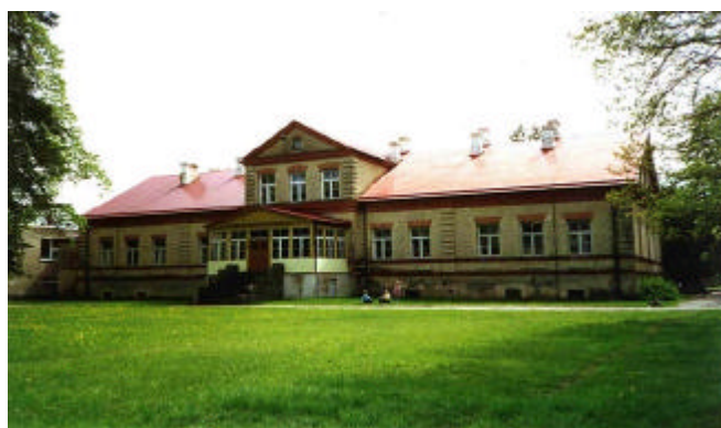
Joonis 4: Adavere mõis