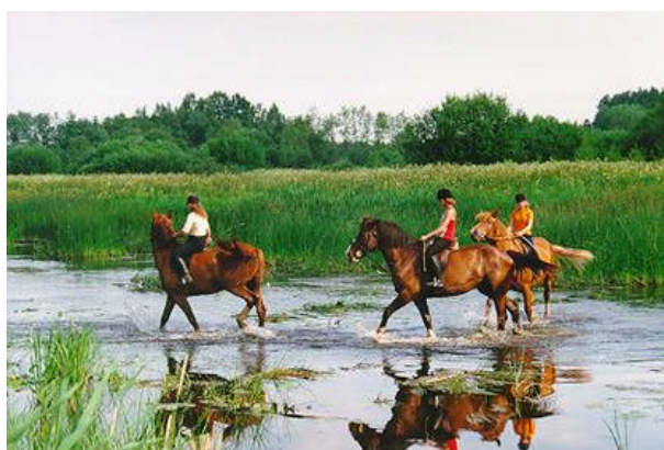
Joonis 10: Ratsamatkad

Kanuusid on võimalik laenutada ka Mare Koitlalt, Põltsamaa vallavalitsuselt, Jäägi talust ja Tammemäe kostitalust . Viimases on võimalik veel sõita paadiga, matkata, pidada piknikut, ratsutada ning tegeleda jahiturismiga (vt joonis 10). Tammemäe turismitalu pakub erinevaid matkamarsruute, kus põhiliselt tutvustatakse raba taimekooslusi ning ümbruse metsi. Lisaks on võimalik giidi juhendamisel linde vaadelda ning tegeleda fototurismiga. Jalgsimatkadel tutvutakse Pedja jõe kaunite jõeluhtadega ja huvitavate looduslike taimekooslustega.