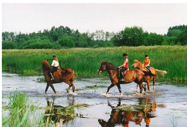
Joonis 10: Ratsamatkad