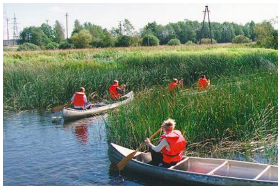
Joonis 9: Kanuumatkad

Kanuusid on võimalik laenutada ka Mare Koitlalt, Põltsamaa vallavalitsuselt, Jäägi talust ja Tammemäe kostitalust . Viimases on võimalik veel sõita paadiga, matkata, pidada piknikut, ratsutada ning tegeleda jahiturismiga (vt joonis 10). Tammemäe turismitalu pakub erinevaid matkamarsruute, kus põhiliselt tutvustatakse raba taimekooslusi ning ümbruse metsi. Lisaks on võimalik giidi juhendamisel linde vaadelda ning tegeleda fototurismiga. Jalgsimatkadel tutvutakse Pedja jõe kaunite jõeluhtadega ja huvitavate looduslike taimekooslustega.